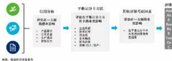
图1 将ESG因素纳入公司信用评级的流程