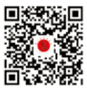
浙江省信用协会 微信公众号二维码