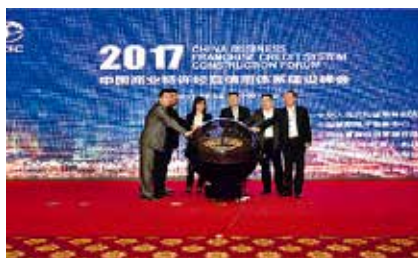
连续举办全国商务诚信建设大会