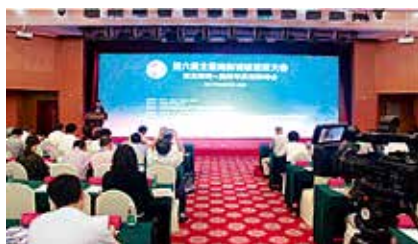
中国商业特许经营信用体系建设峰会