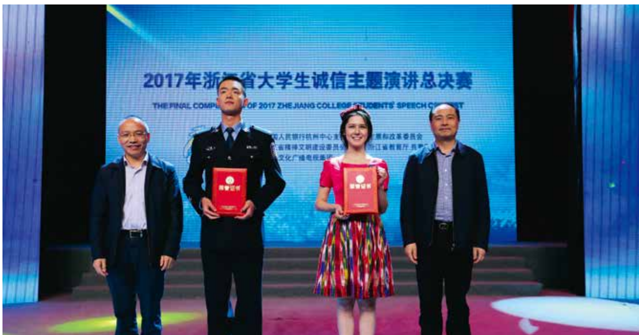
一等奖和最佳人气奖