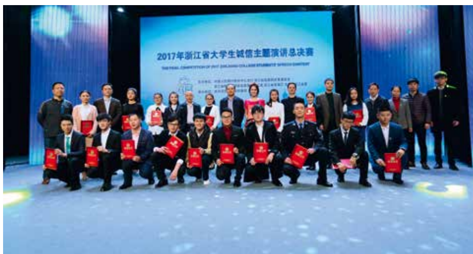
获奖选手和颁奖嘉宾集体合照