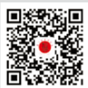
浙江省信用协会 微信公众号二维码